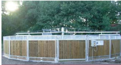
Stall Groener, Denekamp (NL)