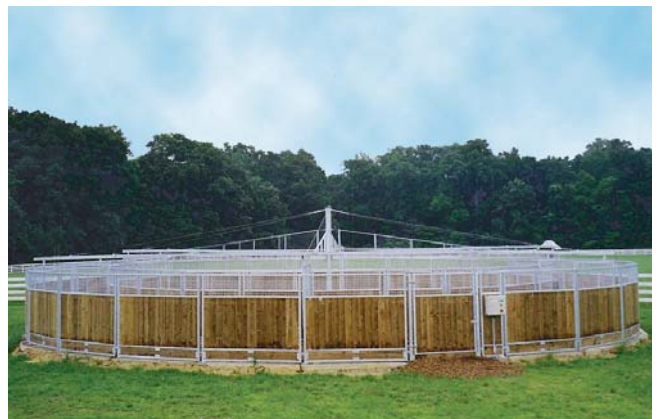
Courtland-Farm, Easton Maryland (USA)