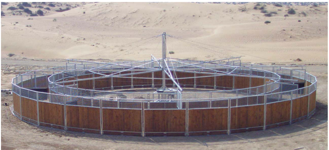
Ajman-Stable, Ajman (VAE)

Uwe Kraft Reitsportgeräte & Metallbau GmbH