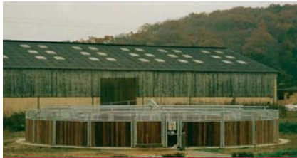
Reitanlage Noesen, Weyer, (L)