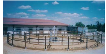
Reitanlage Bartmann, Worms (D)