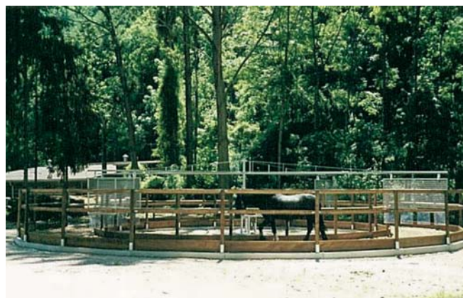
Pferdefreunde Pfullingen, Pfullingen (D)