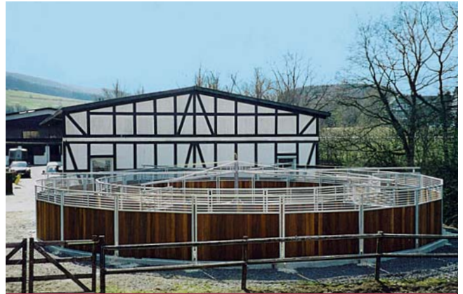
Gestüt Repetal, Attendorn (D)