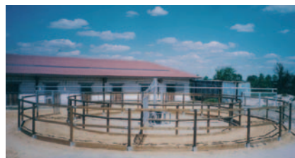
Reitanlage Bartmann, Worms (D)