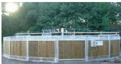
Stall Groener, Denekamp (NL)