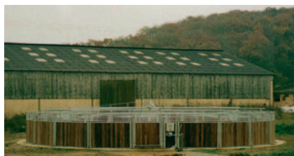
Reitanlage Noesen, Weyer, (L)