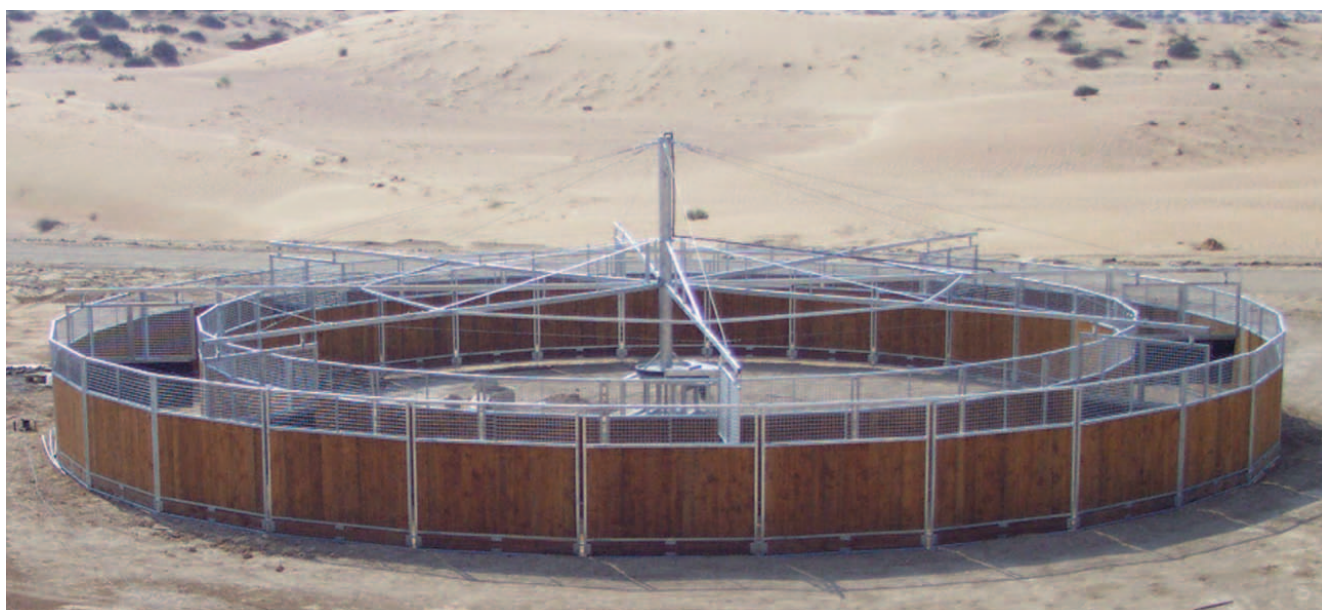
Ajman-Stable, Ajman (VAE)

Uwe Kraft Reitsportgeräte & Metallbau GmbH