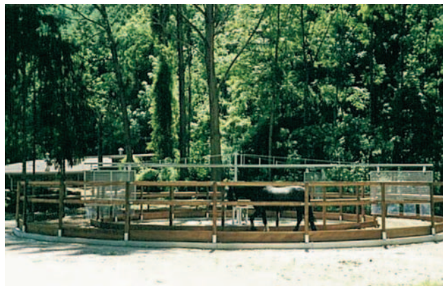
Pferdefreunde Pfullingen, Pfullingen (D)