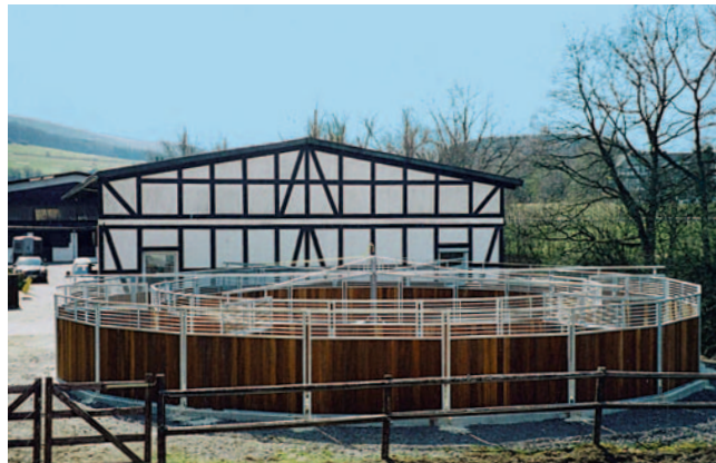
Gestüt Repetal, Attendorn (D)