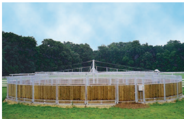
Courtland-Farm, Easton Maryland (USA)