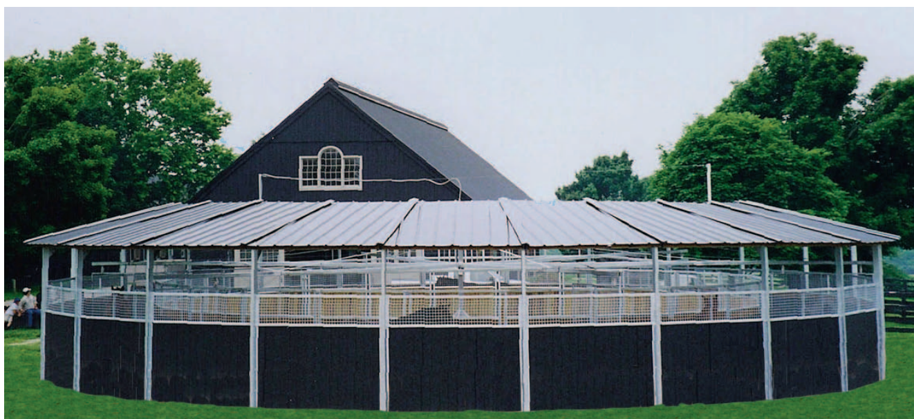
Overbrook-Farm, Lexington, Kentucky (USA). Giostra per cavalli con pannelli da terra Kraft a ferro di cavallo in lamiera grecata

Uwe Kraft Reitsportgeräte & Metallbau GmbH