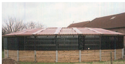
Reitanlage Bartolini, Mortroux, (B) Riparo per gli il corridoio realizzato con lastre ondulate in cemento di fibra