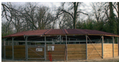
Rennstall Doumen, Lamorlaye, (F) Riparo per gli il corridoio realizzato con pannelli ondulati bituminosi