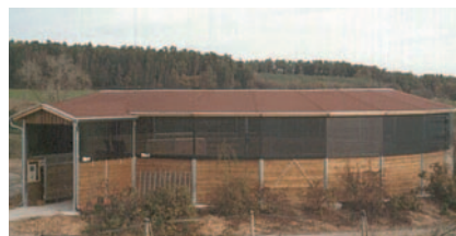
Pensionsstall Phillip, Neuhausen, (D) Riparo per gli il corridoio realizzato con tegole bituminose, tettoia dinaresso e reti frangivento