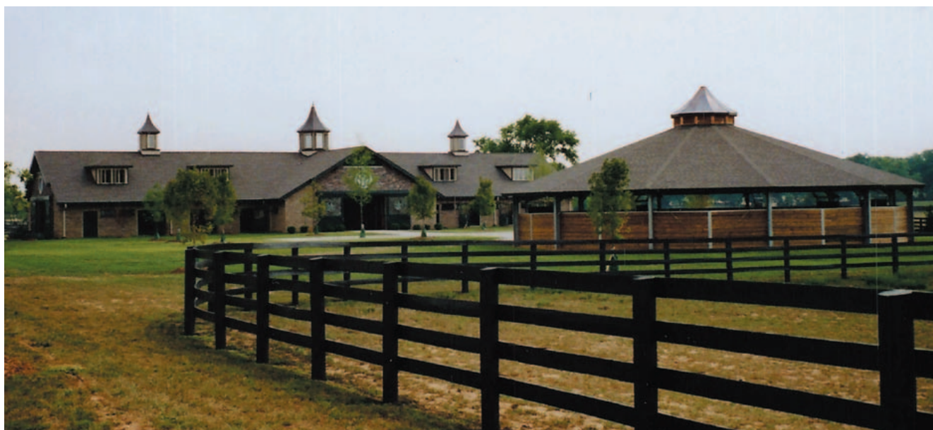
WINSTAR-Farm, Lexington, Kentucky (USA), Giostra per cavalli circolare con tegole bituminose

Uwe Kraft Reitsportgeräte & Metallbau GmbH