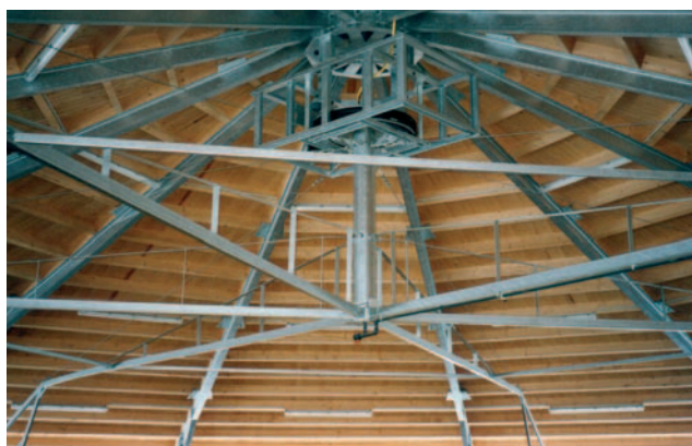
Giostra per cavalli coperta, circolare, area interna libera per addestramento