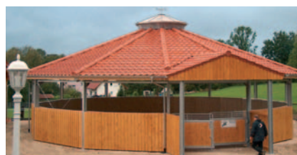
Sig. Wolfsdorf, Denkingen (D), Area addestramento con tegole