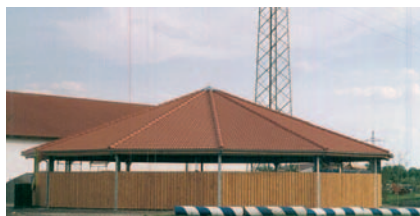
Reitanlage Fenzl, München, (D) Giostra per cavalli coperta circolare, con tondino