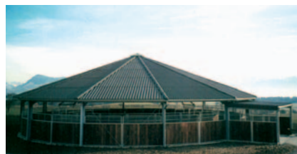
Centro ippico Paul Estermann, Hildisrieden, (CH), Giostra per cavalli coperta con lastre ondulate in cemento di fibra