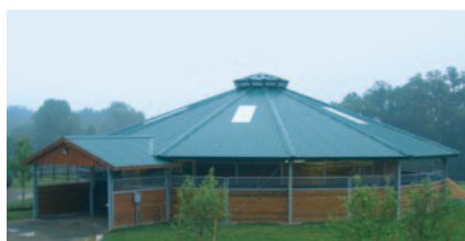
Fairhill Training Center, Oxford, Maryland (USA), Giostra per cavalli di forma circolare